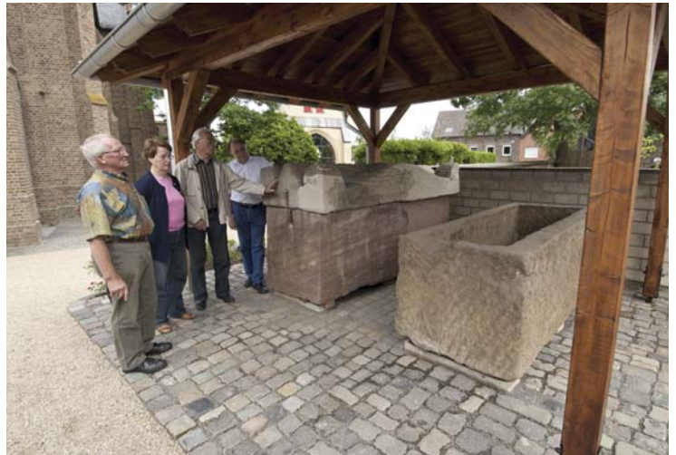
Aufstellungsort der spätantiken Sarkophage auf dem Friedhof von St. Kuni- bert in Zülpich-Enzen (Foto: M. Thuns, LVR-ABR).

Verkehrsamt Zülpich Markt 21, 53909 Zülpich Tel 02252 52-212, Fax 02252 52-299 hg dick@stadt-zuelpich.de www.stadt-zuelpich.de