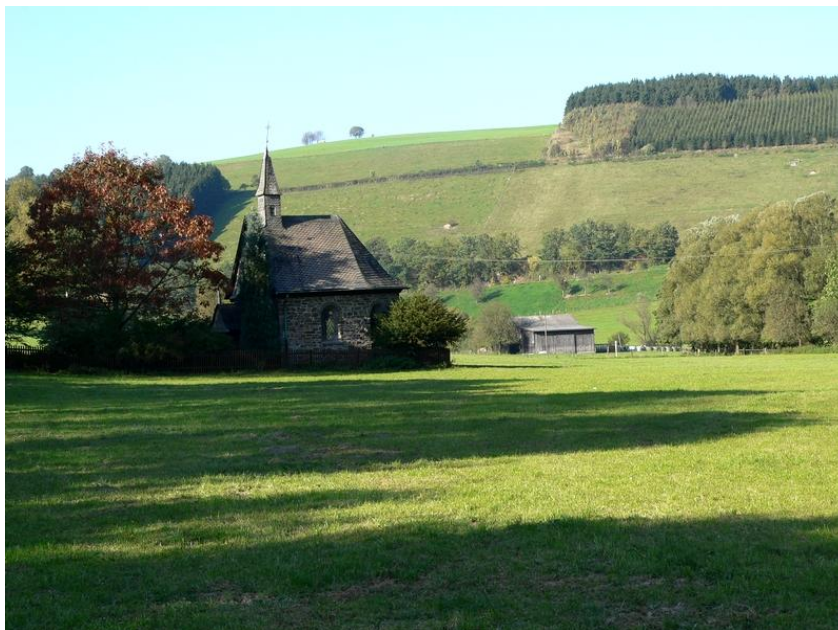
Die Nothelferkapelle in Meschede-Grevenstein, Hochsauerlandkreis

und die Eisenbahn befanden. Diese Konglomerate widersprechen der vermeintlichen Naturidylle des Sauerlandes, sind aber das lebenswichtige Pendant zum ländlichen Raum. Winterberg ist als Wintersportort mit internationalen Wettbewerben eine Besonderheit. Seine Sportanlagen sind landschaftsprägend.