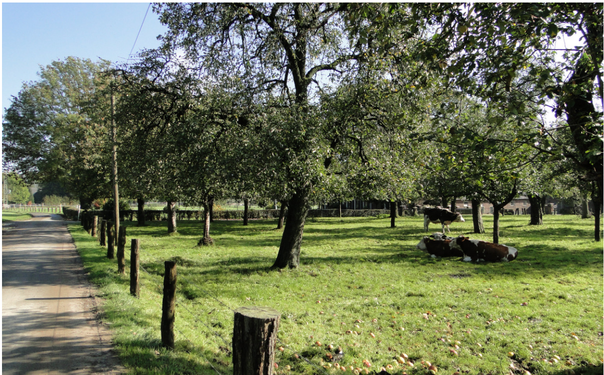
Abb. 1: Typischer Lebensraum eines Steinkauzes im Uedemerbruch – Kulturlandschaftselement Streuobstweide.

Insgesamt konnten 20 Steinkauz-Reviere ermittelt werden. In Relation zu der Flächengröße von 1480 ha des Projektgebietes, ergibt sich eine Revierdichte von 1,3 Revieren pro km 2 , die eine gute Besiedlungsdichte widerspiegelt. Alle Reviere wurden in direkter Nähe von Höfen und Streuobstwiesen gefunden. Dies zeigt, dass der Steinkauz keineswegs die Nähe des Menschen scheut. Er ist als Kulturfolger auf den Erhalt einer gut strukturierten, bäuerlichen Kulturlandschaft mit Grünland, Kopfbäumen und Obstwiesen angewiesen, wie wir sie im Uedemerbruch noch antreffen.