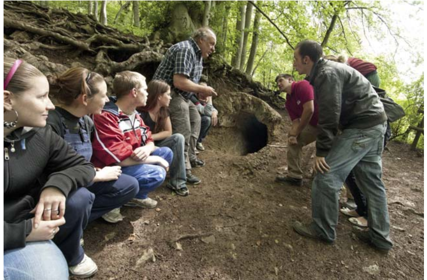
Jugendgruppe am Römerkanal in Kall-Dalbenden.