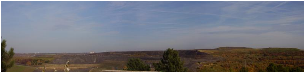
Haldenlandschaft bei Herten, Kreis Recklinghausen

Nach dem Ersten Weltkrieg verstärkten sich die schon seit der Jahrhundertwende zu konstatierenden Ansätze zur Raumplanung erheblich. Der Emscherzone stand die Ruhrzone als bevorzugtes Wohngebiet besserverdienender Bevölkerungsschichten mit Villenvierteln und gehobenen Wohnvororten sowie ausgedehnten landschaftlich reizvollen Erholungsgebieten gegenüber. So gesehen wurde damals die Segregation innerhalb des Ruhrgebiets größer. Die Entwicklung der Südzone zum bevorzugten Wohngebiet der Industriegroßstädte der Hellwegzone hatte verstärkt um 1920 eingesetzt. Diese Bewegung ist im Zusammenhang mit der zunehmenden Zentrenbildung sowie der Ausgestaltung des Raumes mit Bildungs-, Freizeit- und Erholungseinrichtungen zu sehen. Die Zentren des polyzentrischen Ballungsraumes Ruhrgebiet wuchsen mehr und mehr zusammen, wodurch ein immer stärkerer Druck auf die dazwischen liegenden Grünzonen entstand. Für die Koordinierung der planerischen Aktivitäten war deshalb die Gründung des Siedlungsverbandes Ruhrkohlenbezirk mit Sitz in Essen 1920 besonders wichtig ( 1979 in Kommunalverband Ruhrgebiet umgewandelt, seit 2005 Regionalverband Ruhr ). Dieser konzentrierte sich nicht nur auf die Erhaltung und Ausweitung der Grünzonen, sondern ebenso auf die Erschließung von Naherholungsräumen, wozu auch der Ausbau des Nahverkehrsnetzes gehörte. Um die Städte entstanden für Erholungszwecke und Freizeitgestaltung Schrebergartengürtel und Sporteinrichtungen.