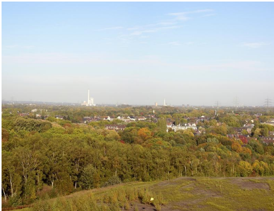
Gelsenkirchen, Rhein-Elbe Halde

Die Zentren der alten Städte, Freiheiten und Kirhdörfer werden bis heute ganz wesentlich von den zumeist noch spätmittelalterlichen – teilweise nach Kriegs-