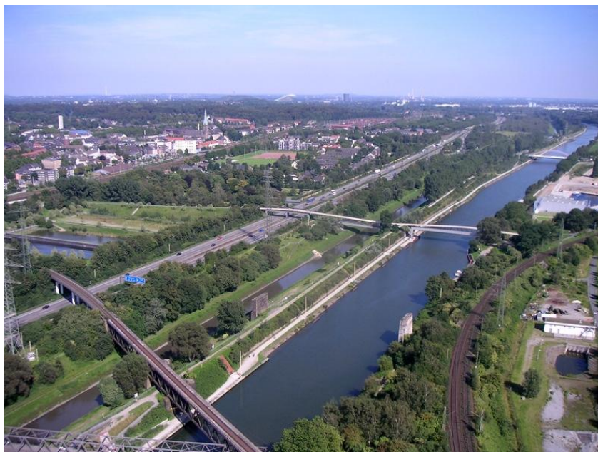
Blick über Oberhausen Margit Philipps, LWL-Amt für Landschafts- und Baukultur in Westfalen, 2004

Die neu errichteten Werks- bzw. Genossenschaftssiedlungen setzten sich meist aus größeren Reihenhäusern zusammen, die nicht mehr von Gärten, sondern von Rasenflächen umgeben waren. Insgesamt wurden insbesondere in den 1950er Jahren umfangreiche vorher land- und forstwirtschaftlich genutzte Flächen erstmals bebaut. Am Ende der 1950er Jahre zeigten sich erste Anzeichen einer schwerwiegenden Strukturkrise. Es kam zu den ersten Zechenstilllegungen, denen bis zur Gegenwart die meisten der um 1950 bestehenden Zechen folgten: 1958 gab es 128 fördernde Zechen, 1988 nur noch 22, im Jahr 2007 sind es noch acht. Insbesondere seit den späten 1970er Jahren, nach kohlekrisebedingter Gründung der Ruhrkohle AG 1968, erfolgte ein massiver Strukturwandel, der auch die industrielle Kulturlandschaft betrifft. Die Anlagen der stillgelegten Zechen wurden in den 1960er und 1970er Jahren in der Regel restlos oder zumindest größtenteils beseitigt. Auf den freigewordenen Flächen siedelten sich neue Industriebetriebe unterschiedlicher Ausrichtung an, die häufig die vorhandene Infrastruktur, vor allem die Verkehrsanlagen weiter nutzten. Teilweise kam es auch zu ungeplanten wilden Neunutzungen unter Verwendung von Teilen des Gebäudebestandes. Für einige der stillgelegten Bergwerke sind allerdings andere Nutzungen gefunden worden. Beispielhaft ist die ehemalige Gute Hoffnungshütte in Oberhausen zu nennen. Nach der Stilllegung errichtete man hier ein neues Einkaufs- und Stadtzentrum, Oberhausen Centro.