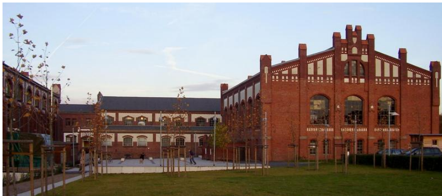
Zeche Waltrop, Kreis Recklinghausen Michael Höhn, LWL-Amt für Landschafts- und Baukultur in Westfalen, 2006

Waltrop "explodiert" binnen 15 Jahren vom 1.500-Seelen-Dorf zur 20.000 Einwohner zählenden Mittelstadt, als 1903-1906 zur Bekohlung der kaiserlichen Flotte die Zeche Waltrop an die Hamm-Osterfelder Bahn und die Kanäle gesetzt wurde. In Gladbeck verursachten die Möllerschächte in Ellinghorst, wie die Zeche Mathias Stinnes 3/4 in Brauck, die Zeche Zweckel in Zweckel, ferner die Gewerkschaft Brassert in Marl mit ihrer ausgedehnten Kolonie oder die Zeche Fürst Leopold 1/2 in Dorsten-Hervest ähnliche Phänomene. Nach dem Ersten Weltkrieg wurde in Recklinghausen die Großzeche König Ludwig ausgebaut; nochmals entstand ein eigener großer Stadtteil mit ausgedehnten Siedlungen immer noch unter Ausnutzung der Hamm-Osterfelder Eisenbahn. In der Nationalsozialistischen Zeit wurde der Industriezweig der Petrochemie in intensiviert.