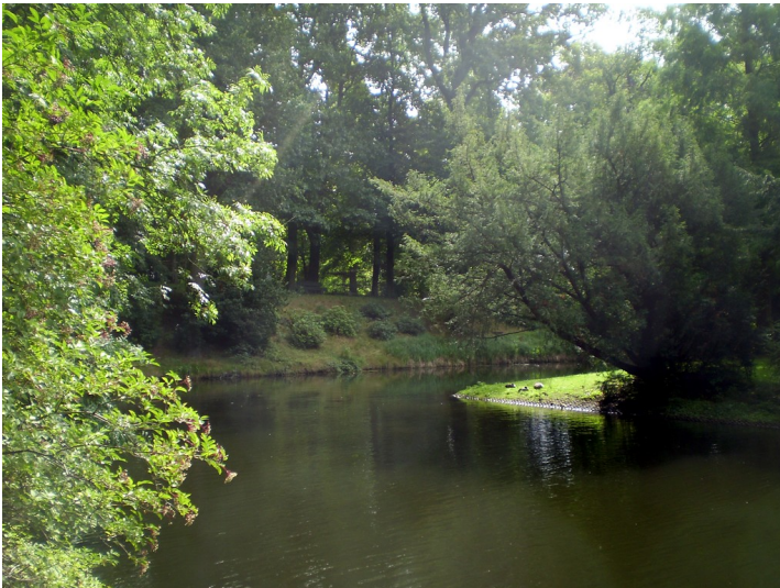
Burggraben der Burg Brüggen (2012)