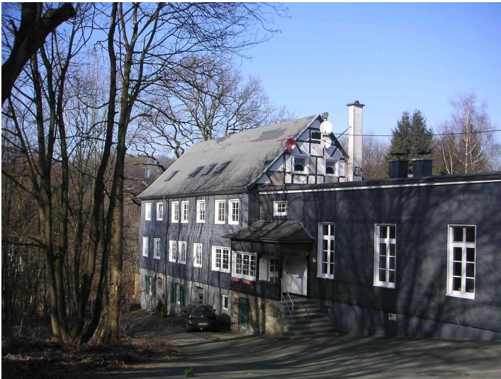
Ehemaliges Klubheim der Belegschaft der Firma Wülfig in Grunewald (2008)