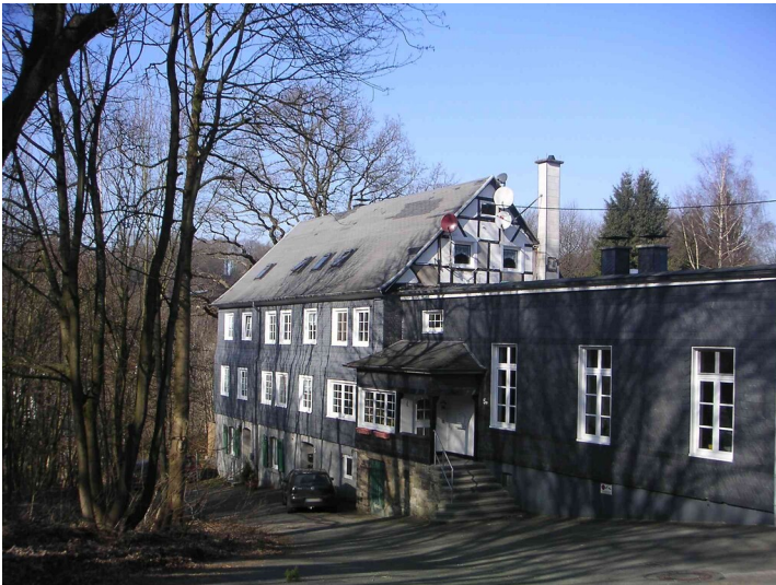
Ehemaliges Klubheim der Belegschaft der Firma Wülfig in Grunewald (2008)