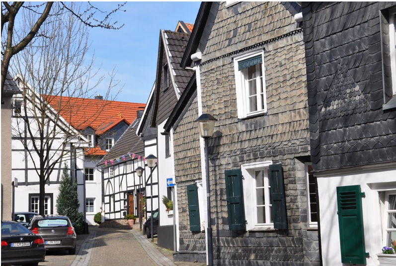
Kaiserstraße in Essen-Kettwig (2011).