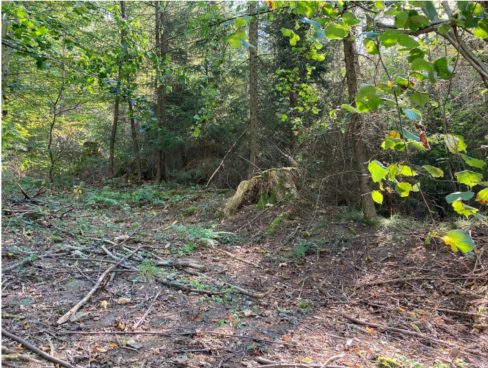
Grenzwall der Hereditas Berge (2020)