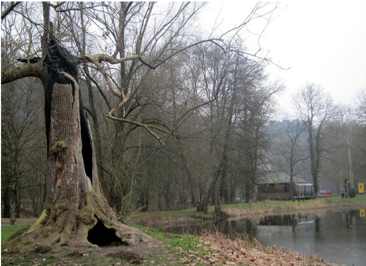
Baumruine am Klosterteich im Norden der ehemaligen Zisterzienserabtei Altenberg (2012)