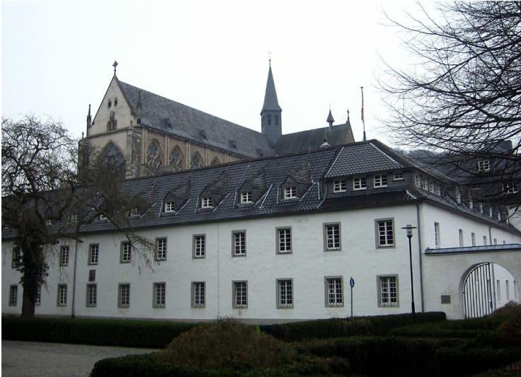
Zisterzienserabtei Altenberg, Haus Altenberg (2012)