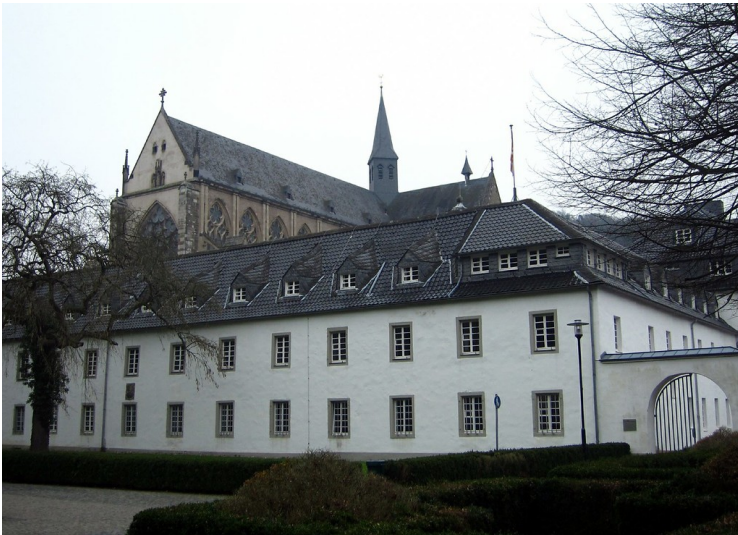
Zisterzienserabtei Altenberg, Haus Altenberg (2012)