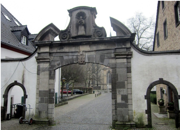
Barocktor der ehemaligen Zisterzienserabtei Altenberg, Außenansicht (2012)