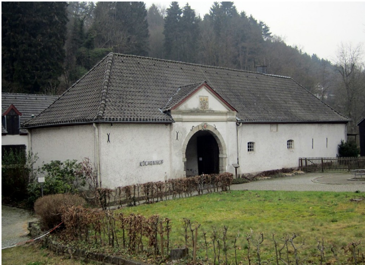
Zisterzienserabtei Altenberg, Küchenerhof (2012)