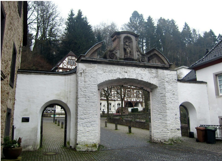
Barocktor der ehemaligen Zisterzienserabtei Altenberg, Innenansicht (2012)