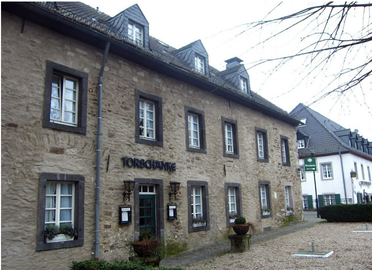
Zisterzienserabtei Altenberg, Altes Brauhaus (2012)