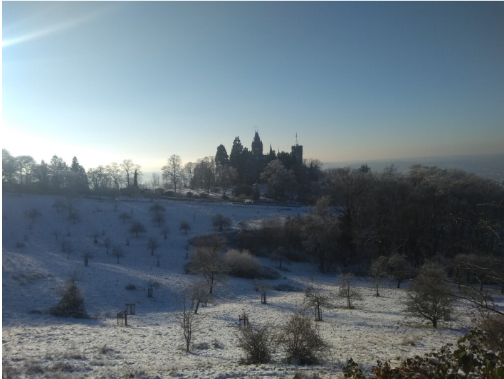
Streubstwiese am Burghof (2022).

Fachsicht(en): Kulturlandschaftspflege, Landeskunde, Naturschutz