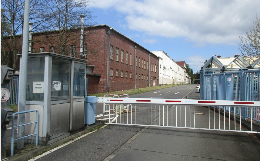
Einfahrt zum Gelände der früheren Zündhütchenfabrik "Züfa" bei Troisdorf, zuletzt bis 2004 Dynamit Nobel AG (2017).

Fachsicht(en): Kulturlandschaftspflege, Landeskunde