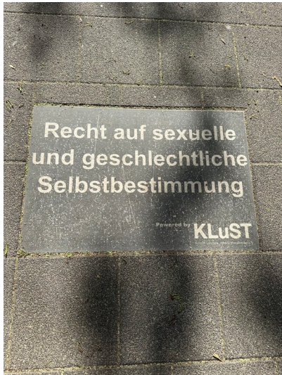
Auf einer der in den gepflasterten Weg eingelassenen Tafeln im Park der Menschenrechte in Köln, die jeweils ein grundlegendes Menschenrecht auflisten, ist das Recht auf sexuelle und geschlechtliche Selbstbestimmung festgehalten (2025). Die Tafel wurde vom Kölner Lebens- und Schwulentag verlegt und trägt daher dessen Schriftzug.