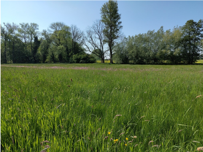
Feuchtwiese im Naturschutzgebiet Grenzdyck mit blühender Kuckuckslichtnelke (2024)

Fachsicht(en): Kulturlandschaftspflege, Naturschutz