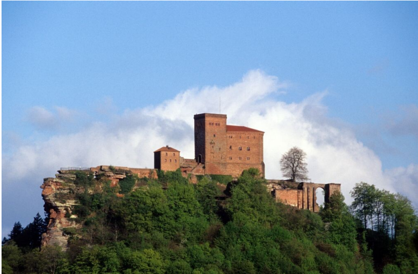
Blick auf die Reichsburg Trifels von Osten (2007)

Fachsicht(en): Landeskunde, Architekturgeschichte