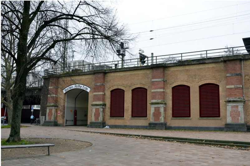
Empfangsgebäude des Bahnhofs Rothe Erde in Aachen (2014), Zugang Beverstraße

Fachsicht(en): Kulturlandschaftspflege, Landeskunde