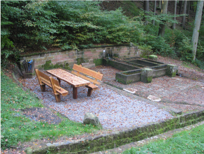
Schelmenteichbrunnen in Esthal