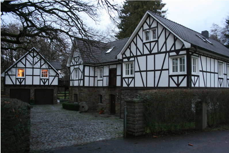
Der Gebäudekomplex der Altenhofer Mühle. Im rechten Gebäudeflügel befand sich früher die Ölmühle im mittleren Trakt die Getreidemühle (2013)