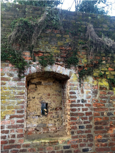
Mauern am Torbogen von Schloss Liedberg (2018)

Fachsicht(en): Kulturlandschaftspflege, Landeskunde