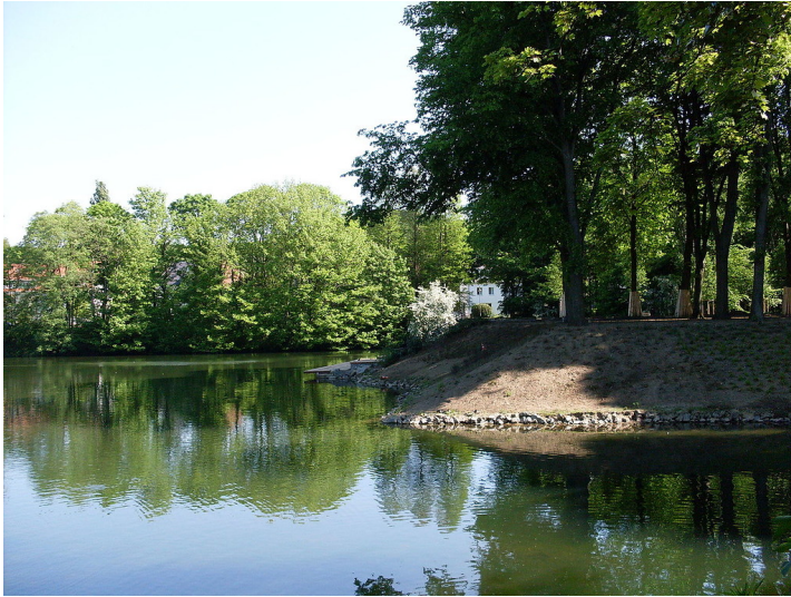
Blick auf den Weiher im Düsseldorfer Ostpark im Stadtteil Grafenberg (2008).

Fachsicht(en): Kulturlandschaftspflege, Landeskunde