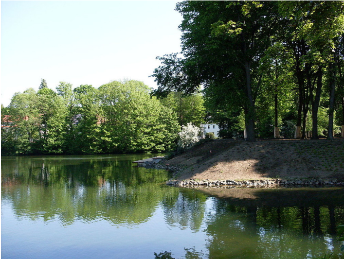
Blick auf den Weiher im Düsseldorfer Ostpark im Stadtteil Grafenberg (2008).

Fachsicht(en): Kulturlandschaftspflege, Landeskunde