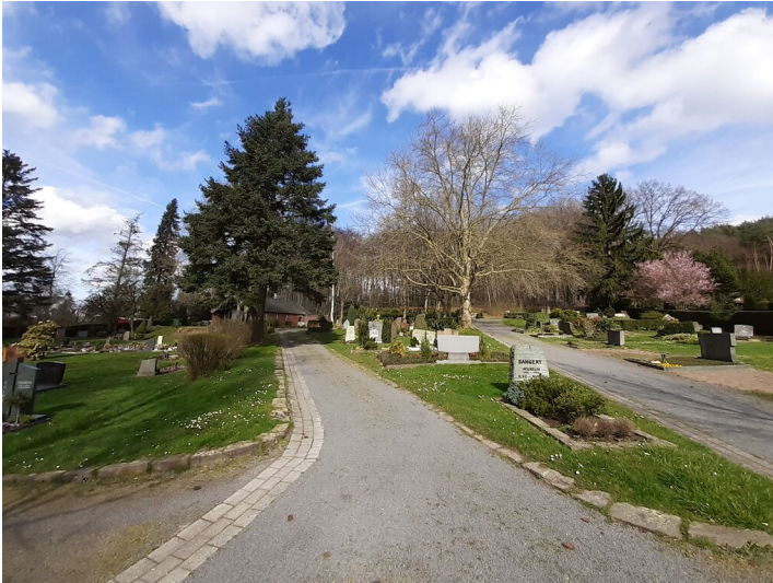
Eine weite Aufnahme des Friedhofes in Bonn-Holzlar (2020), zu erkennen sind mehrere Gräber, Bäume, Wege und Wiesen.

Fachsicht(en): Kulturlandschaftspflege, Denkmalpflege, Landeskunde, Naturschutz