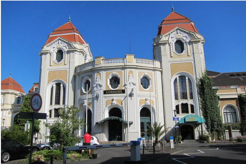
Kurhaus Bad Neuenahr (2013)

Fachsicht(en): Kulturlandschaftspflege, Landeskunde