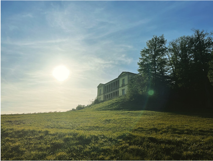
Villa Ludwigshöhe bei Edenkoben (2022)