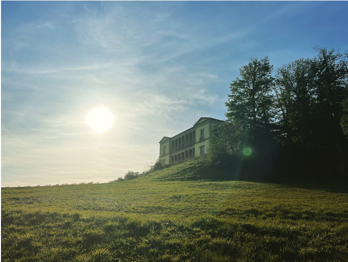
Villa Ludwigshöhe bei Edenkoben (2022)