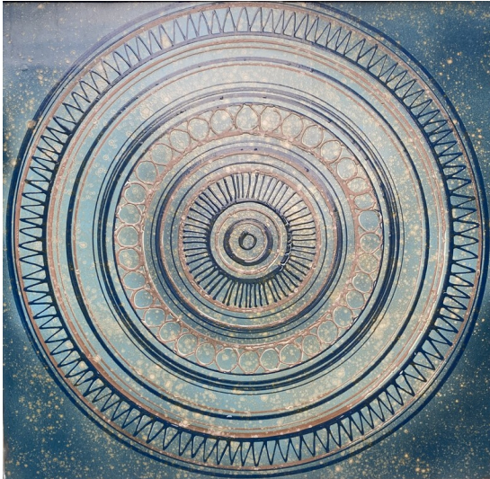
KerAion-Platte des ehemaligen "Mexiko-Baus" am Keramion (2024)