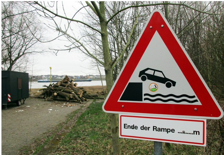
Ein Verkehrsschild warnt Autofahrer vor dem Ende der Rheider Zufahrt zu der so genannten "NATO-Rampe", der Ersatzübergangsstelle über den Rhein zwischen Bornheim-Widdig und Niederkassel-Rheidt (2024).

Fachsicht(en): Kulturlandschaftspflege, Landeskunde