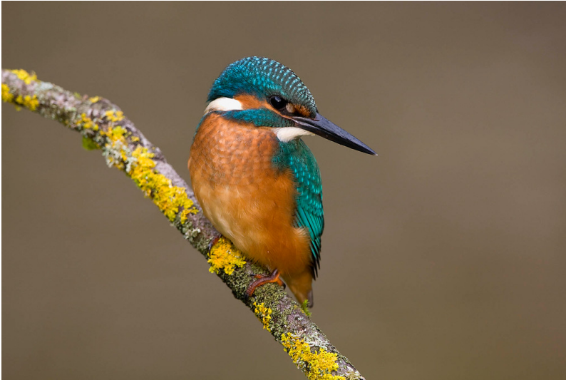
Ein auf einem Ast sitzender Eisvogel an einem Gewässer bei Wesel (2008).

Fachsicht(en): Kulturlandschaftspflege, Naturschutz