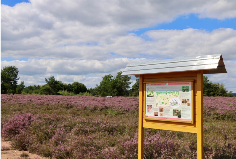
Naturschutzgebiete in Rheinland-Pfalz (2017)