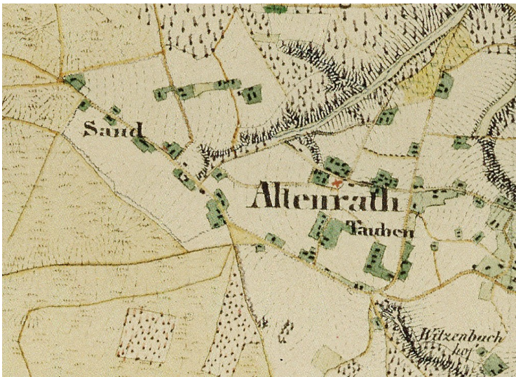
Der Bereich um das heutige (Troisdorf-) Altenrath auf der historischen Karte der preußischen Uraufnahme von 1836-1850. Links im Kartenausschnitt ist noch die untergegangene ehemalige Siedlung Sand zu sehen.

Fachsicht(en): Kulturlandschaftspflege, Landeskunde