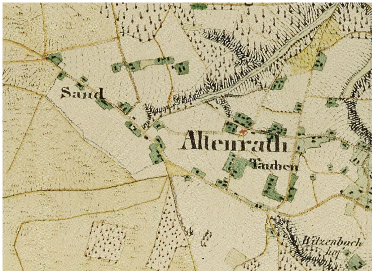
Der Bereich um das heutige (Troisdorf-) Altenrath auf der historischen Karte der preußischen Uraufnahme von 1836-1850. Links im Kartenausschnitt ist noch die untergegangene ehemalige Siedlung Sand zu sehen.

Fachsicht(en): Kulturlandschaftspflege, Landeskunde