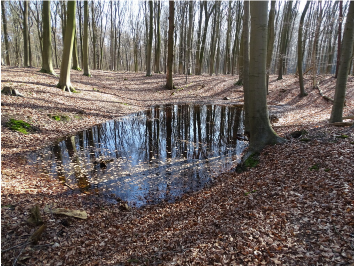
Quelle Wischgraff am Waldboden (2022)

Fachsicht(en): Kulturlandschaftspflege, Naturschutz