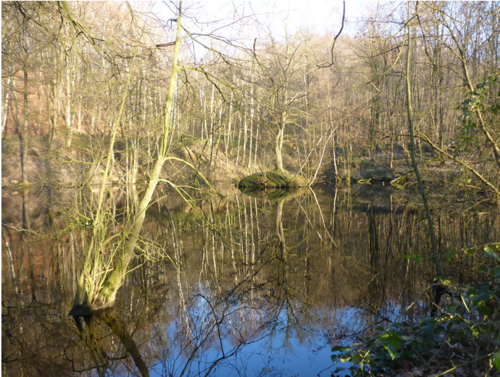
Quellsee der Drususquelle (2022)