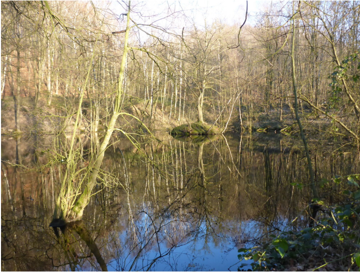
Quellsee der Drususquelle (2022)