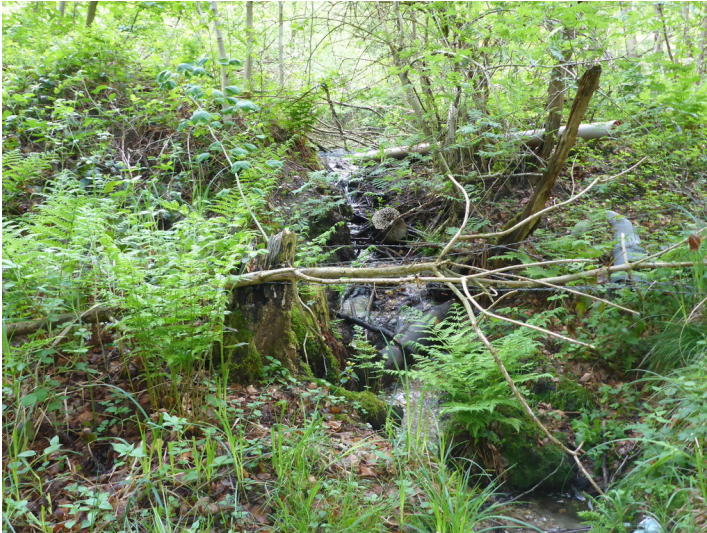
Quellursprung des Hellbachs (2021)