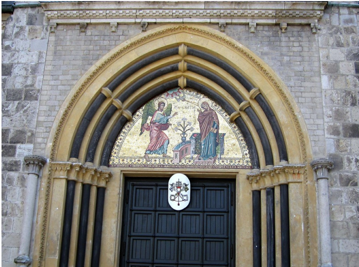
Portal an der Nordseite des Kirchengebäudes des Cassiusstifts (Münster in Bonn, 2011). Zentral am Portal wird auf einer Wappentafel der Ehrentitel einer „Basilica minor“ („kleinere Basilika“) ausgewiesen.

Fachsicht(en): Kulturlandschaftspflege, Landeskunde