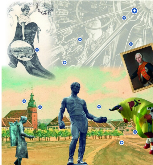
Seite "Interaktive Zugänge und Quizzes zur Schuhindustrie in Pirmasens" (2023)