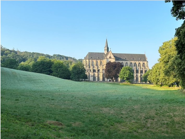
Blick auf die Nordseite des Altenberger Doms vom Eingang der ehemaligen Klosteranlage aus (2023).

Fachsicht(en): Kulturlandschaftspflege , Landeskunde