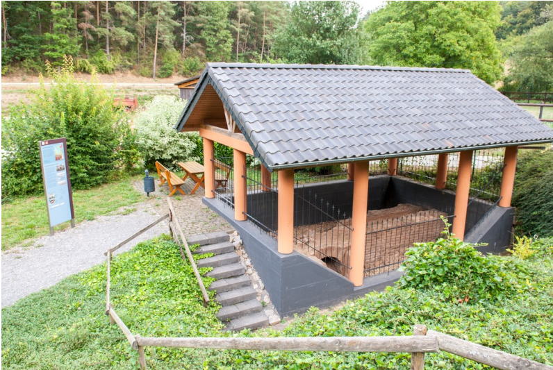
Schutzbau der kleinen Aquäduktbrücke bei Mechernich-Vollem (2023)