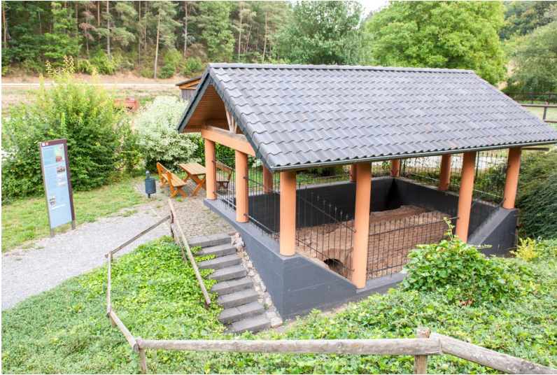
Schutzbau der kleinen Aquäduktbrücke bei Mechernich-Vollem (2023)