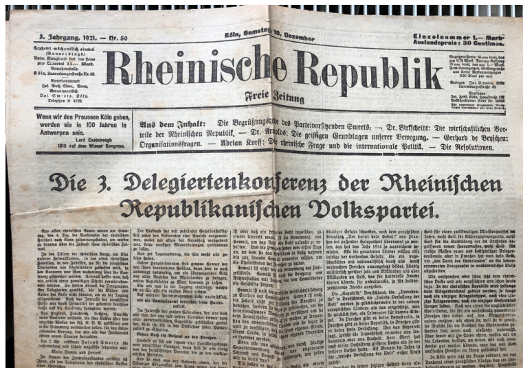
Rheinische Republik/Organ der Rheinisch Republikanischen Volkspartei, Ausgabe vom 10.12.1921