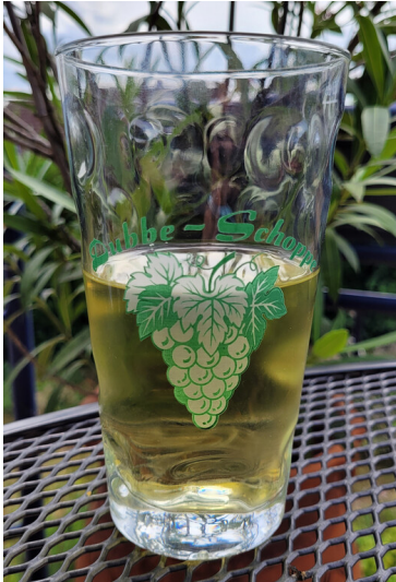
Pfälzer Schoppen und Dubbeglas