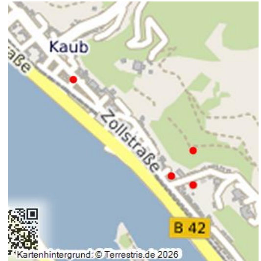
Seite "Videos zum Dachschieferbergbau in Kaub" (2023)

Die Stadt Kaub liegt im Rheinischen Schiefergebirge, Schiefer ist überall präsent. Nicht nur im geologischen Landschaftsbild, sondern auch in verarbeiteter Form als Mauersteine für den Gebäude- und Stützmauern und insbesondere als Bedeckung für Dächer. Schiefer ist zunächst nur ein Sammelbegriff für Sedimentgesteine, die parallel zu Schieferungsflächen spaltbar sind. So haben der Ölschiefer in der Grube Messel oder aktuell das Schiefergas wenig mit dem Schiefer zu tun, von dem wir hier reden. Die bessere Bezeichnung für den Schiefer, um den es in unserer Region geht, ist Tonschiefer bzw. Dachschiefer, denn nur eine ganz bestimmte petrographische Zusammensetzung machen ihn zu dem Bodenschatz, der wirtschaftlich für diesen Zweck ausgebeutet werden konnte.