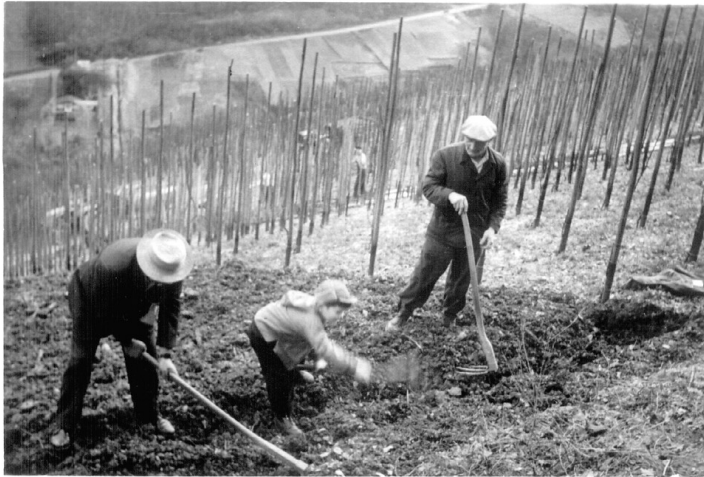
Arbeit im Weinberg