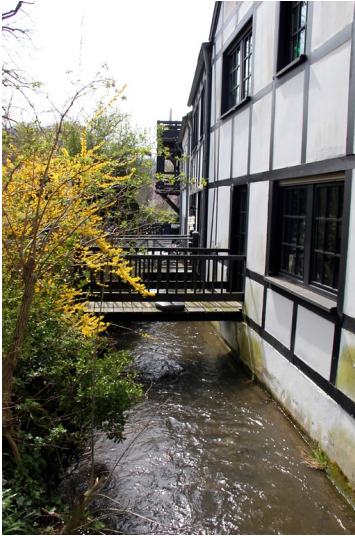
Strunde mit der Wichheimer Mühle in Köln-Holweide (2015).

Fachsicht(en): Kulturlandschaftspflege, Landeskunde